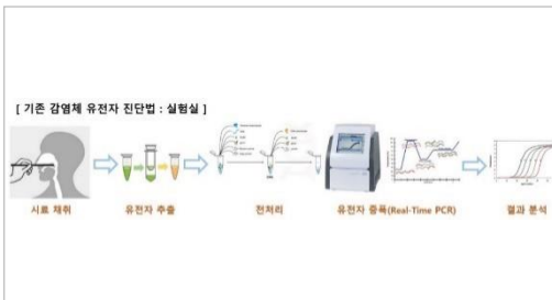
그림 1 기존 감염체 유전자 진단법:실험실