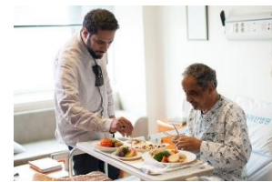
< 특수용도식품 >