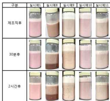
< 생오미자 착즙액+콩즙+당화물 >