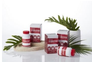
< 건강기능식품 >