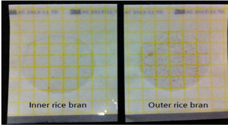
[미생물 오염 정도 확인]