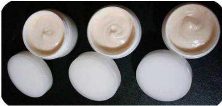
[속미강 추출물을 함유한 피부용 크림]