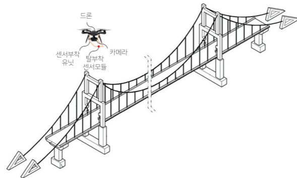
드론을 활용한 진동 기반 구조물 손상 감지 시스템에서 하나의 탈부착 센서모듈을 사용하여 구조물을 계측