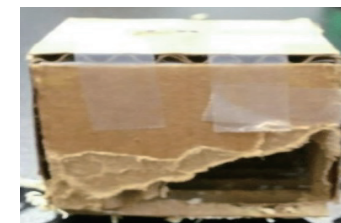
설치류 테스트를 마친 기능성 상자와 일반상자