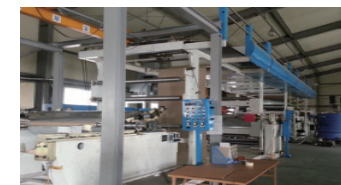
설치된 공정 설비